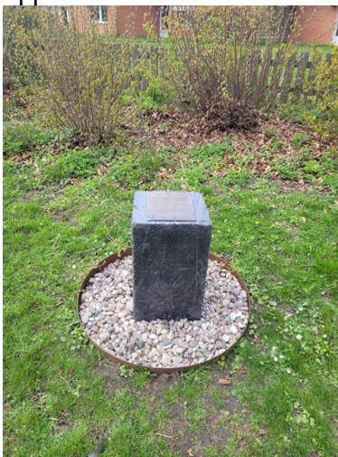
Sten med minnesplatta

Den 9 januari 2023 inkom Simrishamnsförslag (ID: 1232) – Sten med minnesplatta i Lasarettsparken i Simrishamn. Förslaget beviljades och förslagsställaren har därefter anlagt en sten med minnesplatta i parken. Utöver detta har även de tillfälliga installationerna satts upp i området.