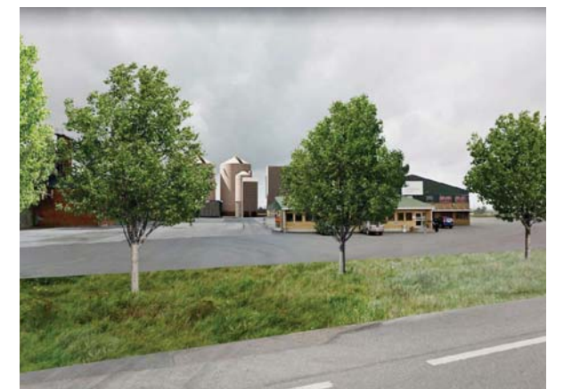
Vy från Herrestadsvågen