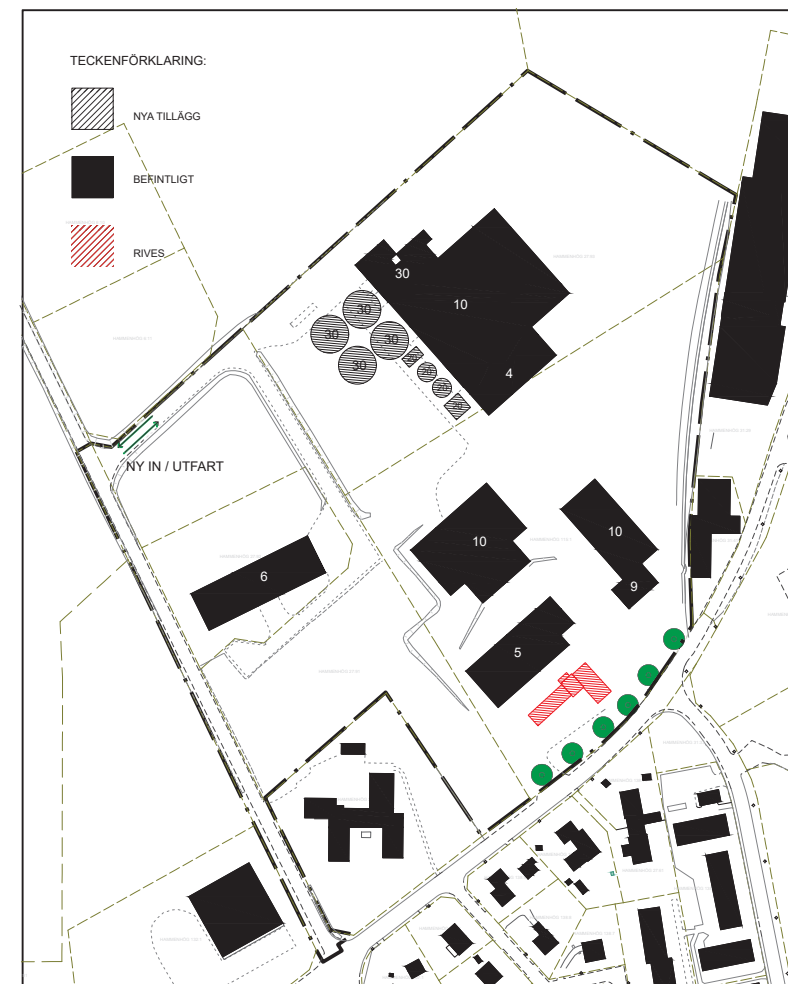
Illustrationskarta skala 1:4000 (A3)