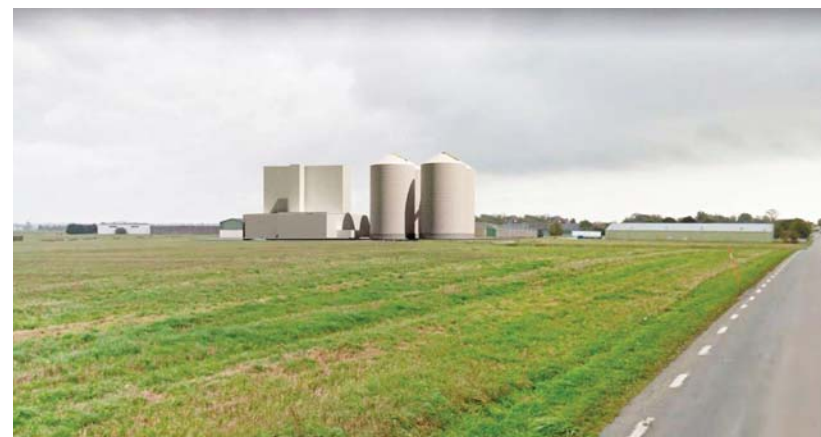
Vy från Smedstorpssvägen

Genomförandetiden slutar 5 år efter det att planen vunnit laga kraft.