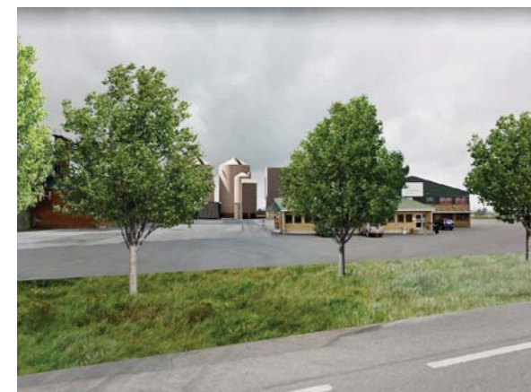
Vy från Herrestadsvägen