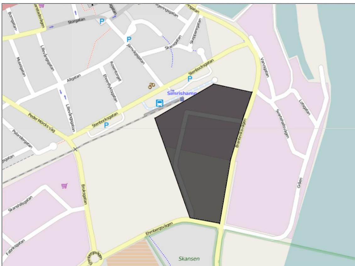
Figur 2: Karta över kvarteret Garvaren och dess omgivning. Det markerade området visar Garvarens ungefärliga omfattning. Karta från OpenStreetMap.

Kvarteret Garvaren ligger i centrala Simrishamn. Kvarteret är idag delvis bebyggt av handel och industrier. Nordväst om området ligger Simrishamns station med anslutande järnväg från sydväst. Nordöst om området ligger en hamn med industrier och handel. Figur 2 visar en översikt av kvarteret Garvaren och dess omgivning.