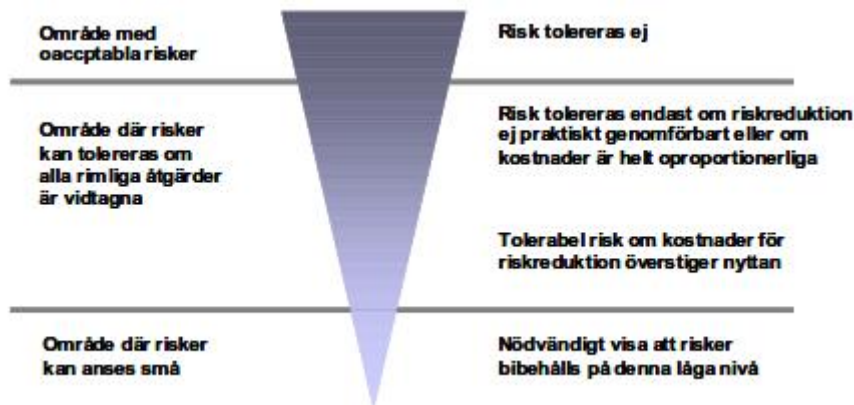
Figur 1: Princip för uppbyggnad av riskvärderingskriterier (Räddningsverket, 1997)

Riskvärderingen gör ett ställningstagande kring huruvida riskerna kan anses vara tolerabla, tolerabla med restriktioner eller inte tolerabla. Denna princip beskrivs översiktligt i nedanstående figur.