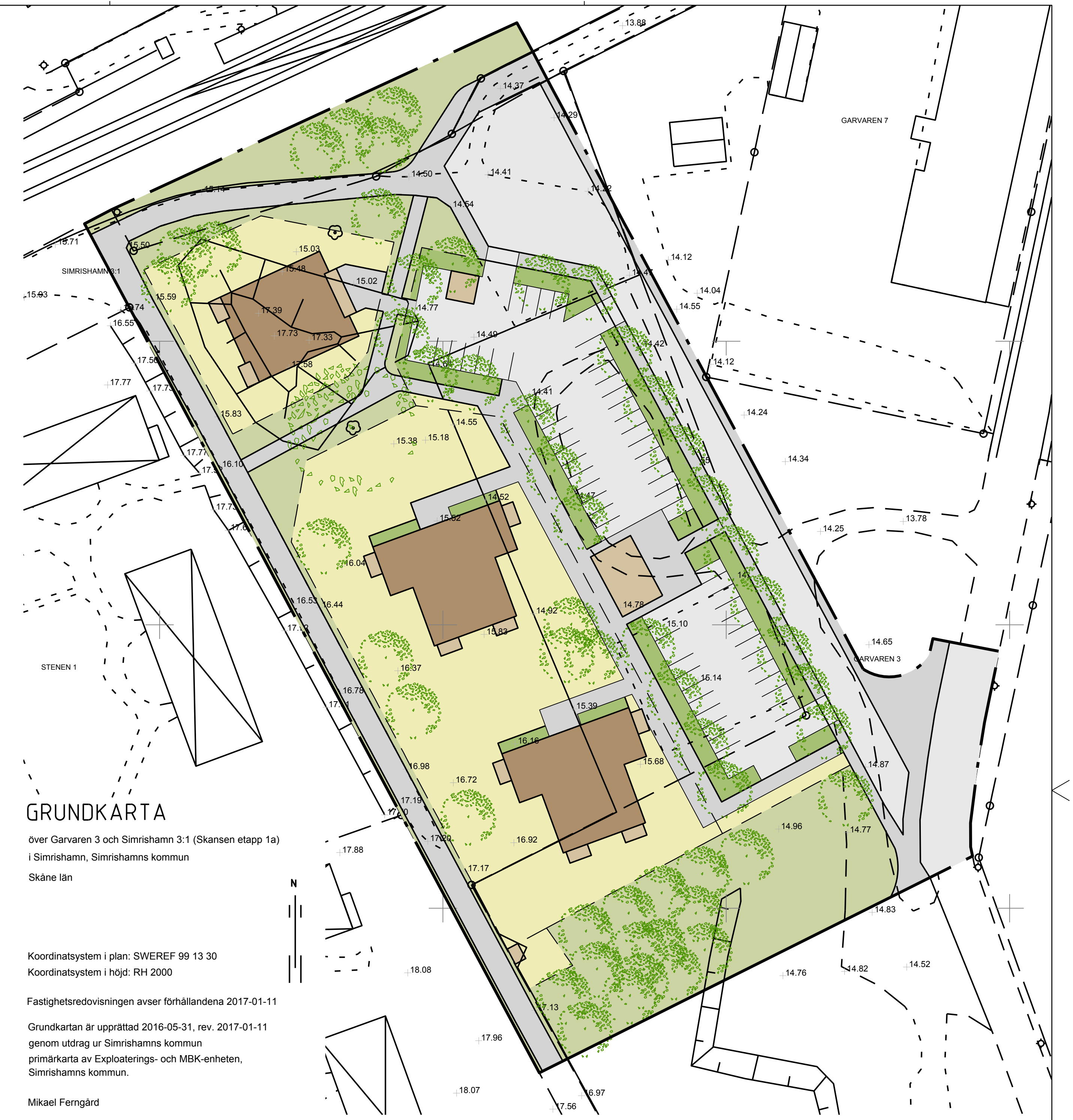
GRUNDKARTA över Garvaren 3 och Simrishamn 3:1 (Skansen etapp 1a) i Simrishamn, Simrishamns kommun Skåne län

Koordinatsystem i plan: SWEREF 99 13 30 Koordinatsystem i höjd: RH 2000 Fastighetsredovisningen avser förhållandena 2017-01-11 Grundkartan är upprättad 2016-05-31, rev. 2017-01-11 genom utdrag ur Simrishamns kommun primärkarta av Exploaterings- och MBK-enheten, Simrishamns kommun. Mikael Ferngård