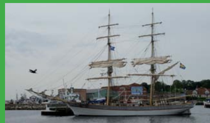
Briggen Tre Kronor i Simrishamn.

I början av augusti besökte Briggen Tre Kronor Simrishamn över ett veckoslut. Tillsammans med Klara Marie erbjöd man Simrishamnsbor och besökare ett gediget program med visningar av skeppen, seglingar och jazzkväll ombord. Tre Kronors besättning var mycket glad för det fina välkommandet i Simrishamn och det stora intresset. Man hann knappt segla vidare förrän planeringen av ett återbesök nästa sommar inleddes. De övriga skutorna från regionen var tyvärr ute på långsegling denna helg, men till nästa år hoppas vi att arrangemanget ska växa och involvera alla. Vilken upplevelse att få se alla segla sida vid sida!