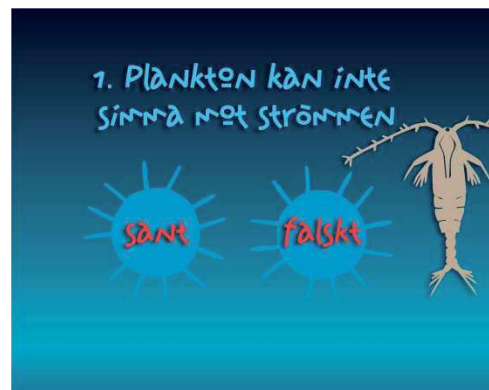
Planktonquiz på utställningen

utställning till Skeppet. Välkomna, barn som vuxna, att lära mer om plankton! Dessa fascinerande små organismer presenteras från många perspektiv – visste du till exempel att vissa typer av plankton kan bli hela 30 meter långa? Eller att man kan se plankton i havet ända från rymden?