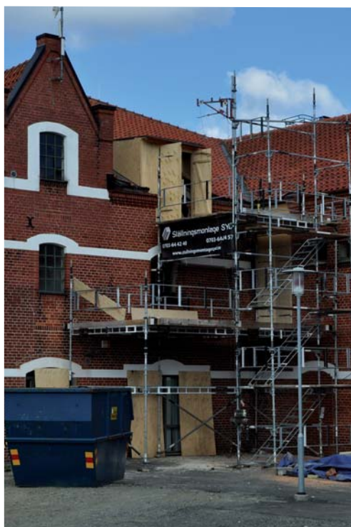
Ombyggnadsarbete på Södra kajen

Projektet pågår från april 2010 till och med mars 2013, med en total budget på ca 5,8 miljoner kronor. Är du intresserad av projektet, kontakta Madeleine Lundin, utvecklingsansvarig för Marint centrum.