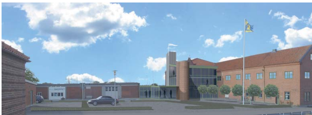
Entrévy mot söder

Det fysiska tillskapandet av Marint centrum genomförs under 2010, med byggstart planerad till mars och i höst är det dags för invigning och inflyttning.