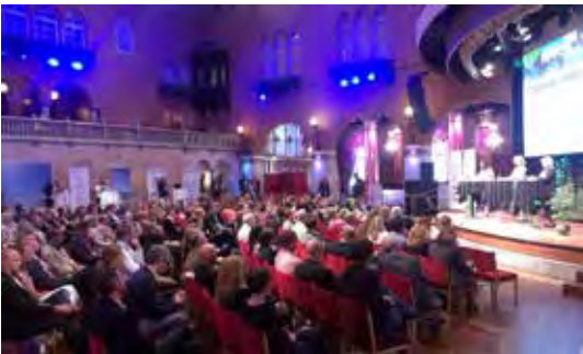
Tillståndet i miljön

Några av dem som talade var miljöminister Lena Ek (C) och Matilda Ernrans (S), ordförande i miljö- och jordbruksutskottet, Allan Larsson, fd finansminister och grundare av Östersjöinitiativet, där även Simrishamns kommun finns med genom Marint centrum.