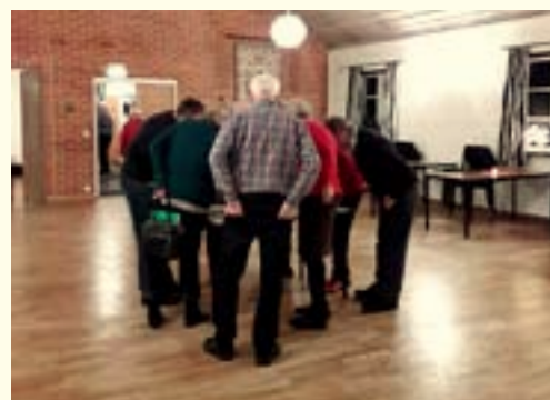
Så här har det sett ut på många platser i kommunen när engagerade medborgare har haft diskussioner över Vägvals kartor och lämnat in förslag på vägnamn.

Se hur det ser ut nu genom att gå in på simrishamn.se , klicka på "Vägval" och följ länken till "Statuskartan". Där ligger hela Simrishamns kommun och du får flyga och dyka ned till den plats du är intresserad av.